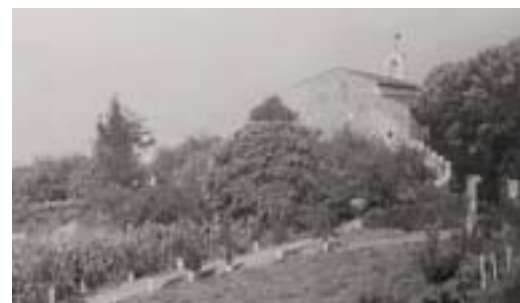
Atxutene jauregitik Ondizko basilikarainoko bidea egin zen. Zabala familia bertara joaten zen elizkizunetara.