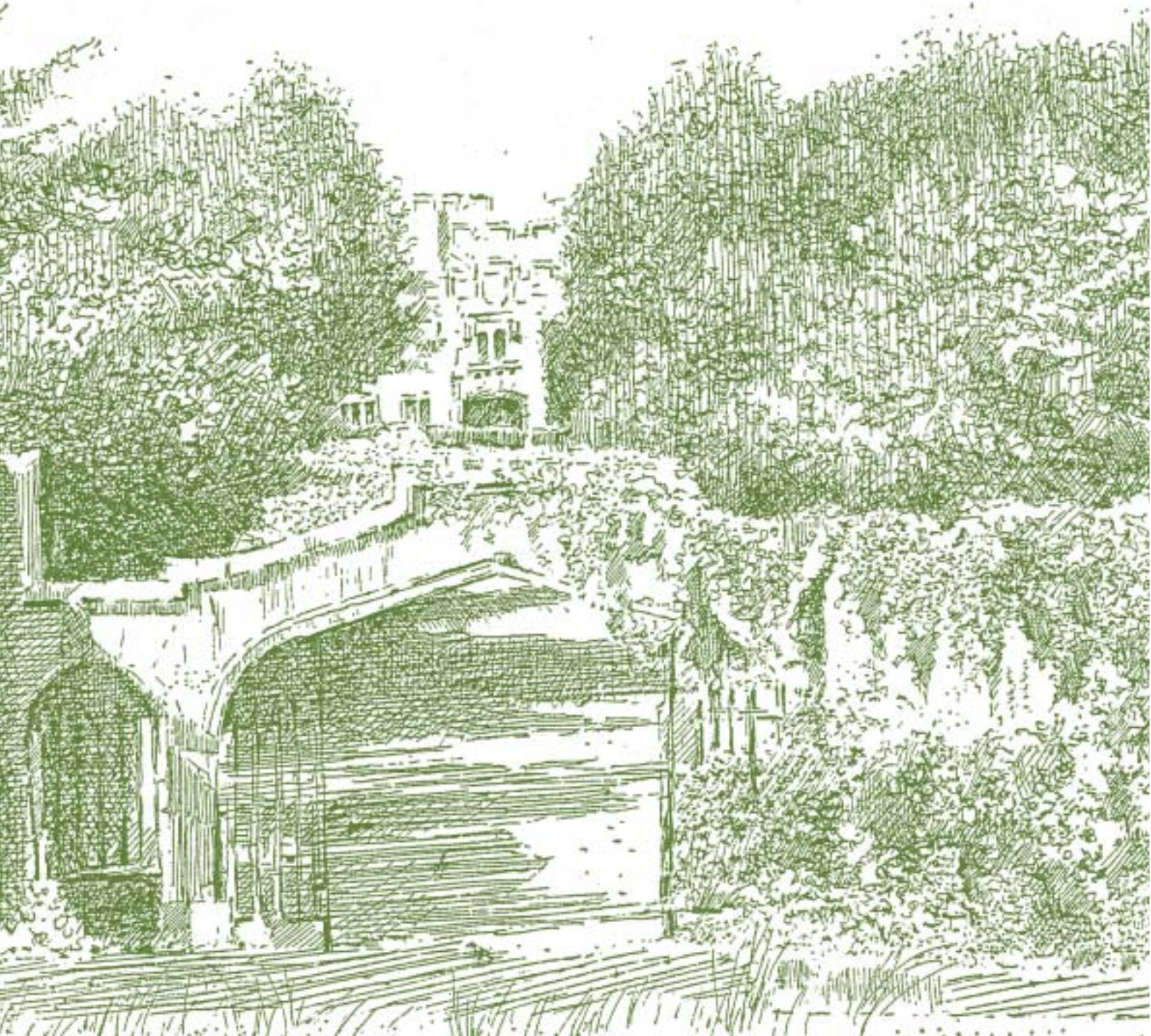
Marrazkiak: J.L. Agirre.