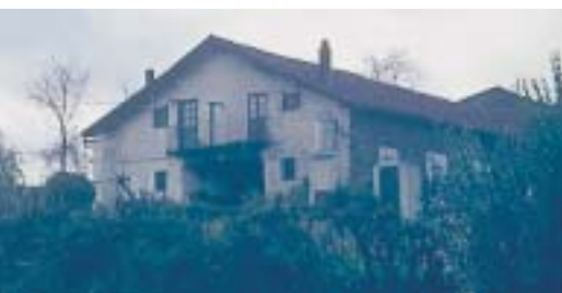
Jauregi baserria, Ondizen. 70eko hamarkada.

Leioandi muinoaren tontorretik hur dago, eta XVI. edo XVII. mendean eraiki zuten. Baserri horrek udalerruari eman dio izena; izan ere, eraikuntza-egiturarik antzinakoena dauka: fatxadan oraindino ez dago atarterik, osagai hori bakeari eta oparoaldiari lotuta dago-eta; kanpoko eskailera batetik sartzen da, Erdi Aroko dorreetara legez.