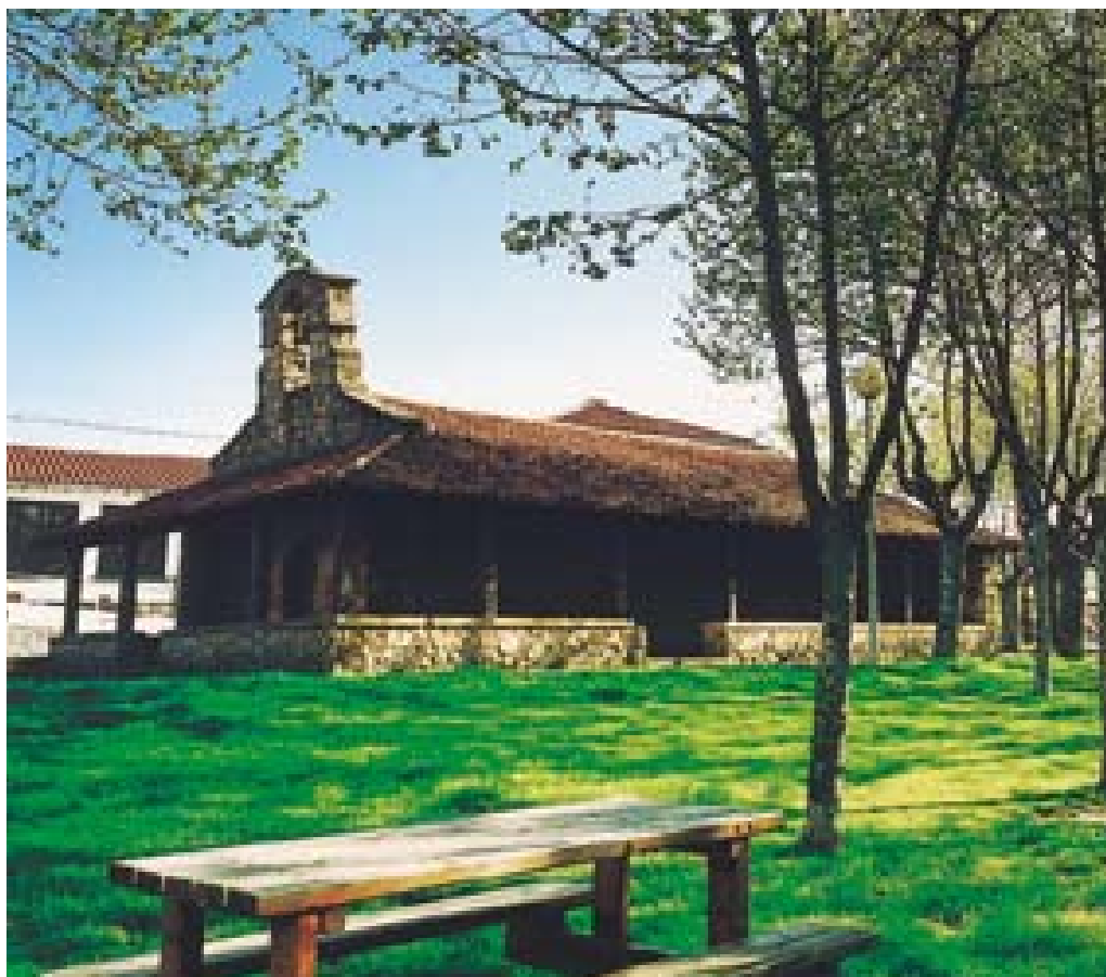
San Bartolome basiliza. Egilea: Asier Bastida.