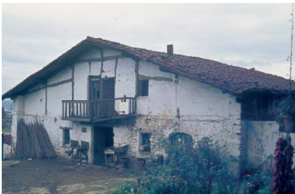
Kortasene baserria. 70eko hamarkada.