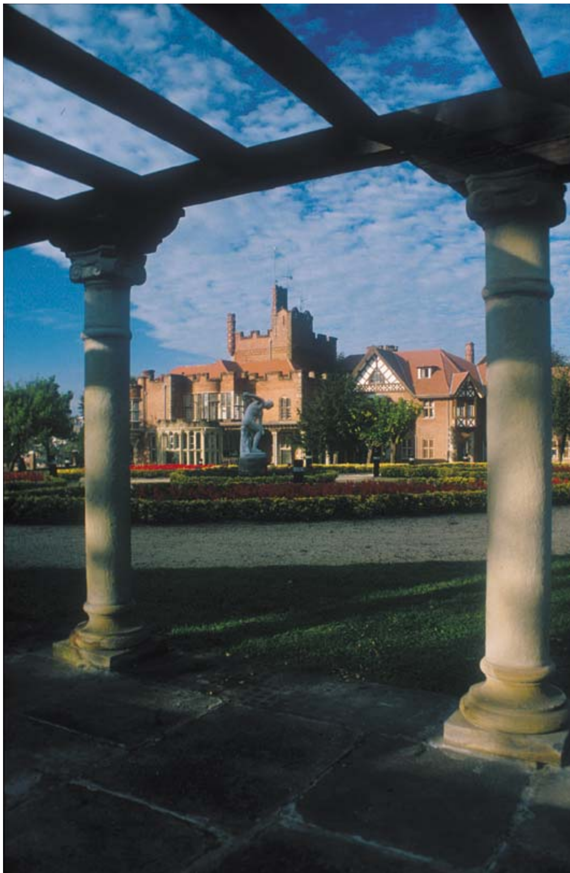
Artatzako jauregiaren ikuspegia pergolatik.