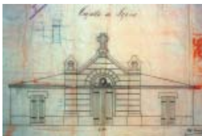
Leioako hilerriko kaperaren planoak. Marcelino Arrupek egin zuen proiektua 1899an. BFAA. Udal Atala. Leioa. Sustapen bulegoa. B-1 KUTXA.