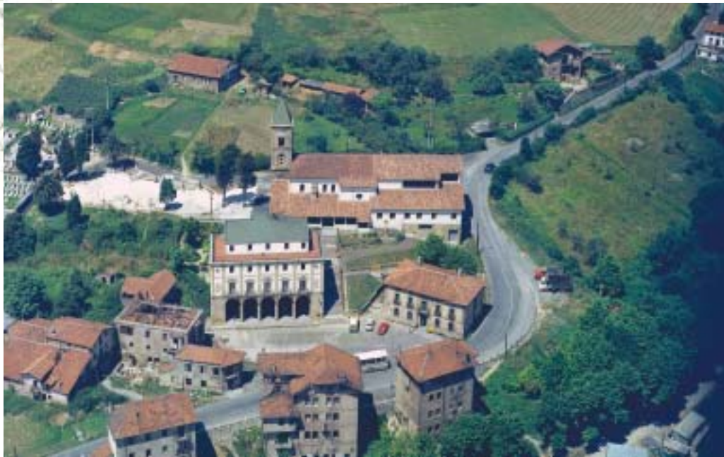
Elexalde auzuneak duela urte gutxi batzuk arte zeukan itxura. FOAT. 1978.