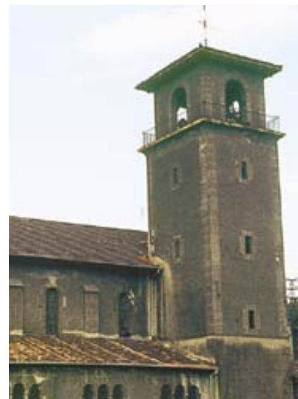
Lamiako San Maximo eliza XX. mendearen hasieran eraiki zuten, eta Maximo Agirre dela-eta eman zioten izena, bere jabetzako lurretan altxatu baitzuten.

Oinplano angeluzuzeneko eraikin honek aldaketak izan ditu eten barik. Hala eta guztiz ere, mendebal alderdian gorde den arku zorrotzeko ate bati esker zehatz dezakegu XVI. mendean eraiki zutela. Isurialde biko estaldura dauka, eta kanpai-horma barrokoak harrizko gurutze bat dauka buruan, eta kofadura bat kanpairako.