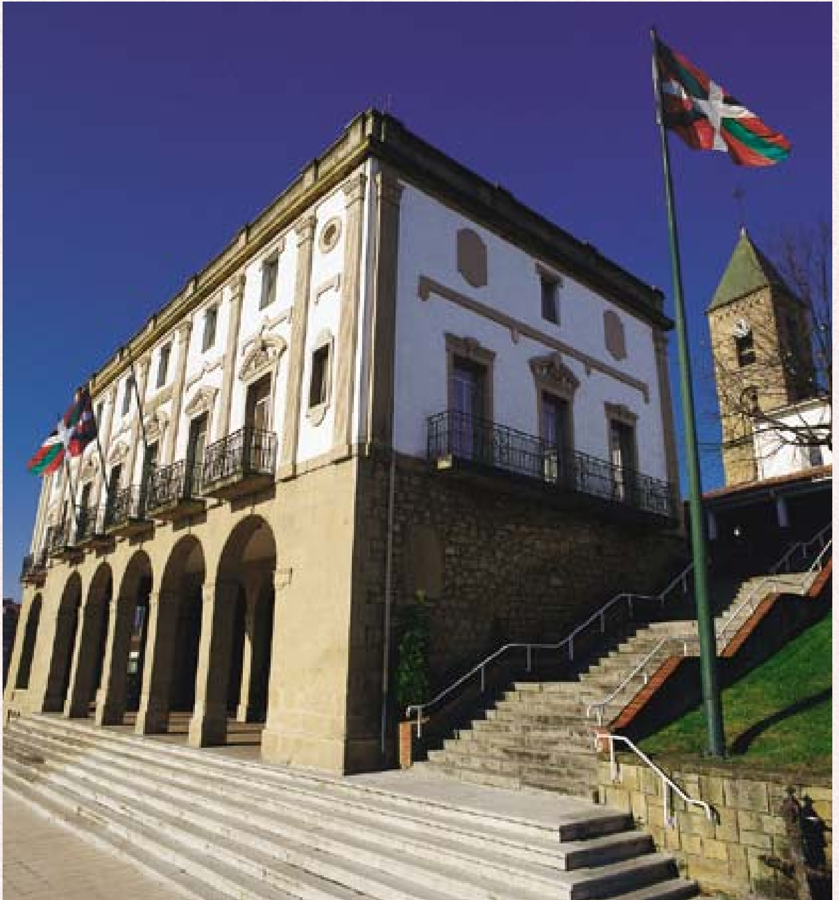
Leioako Udaletxea. Egilea: Asier Bastida