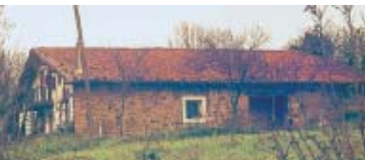
Leioagoiti baserria, Elexalden. 70eko hamarkada.