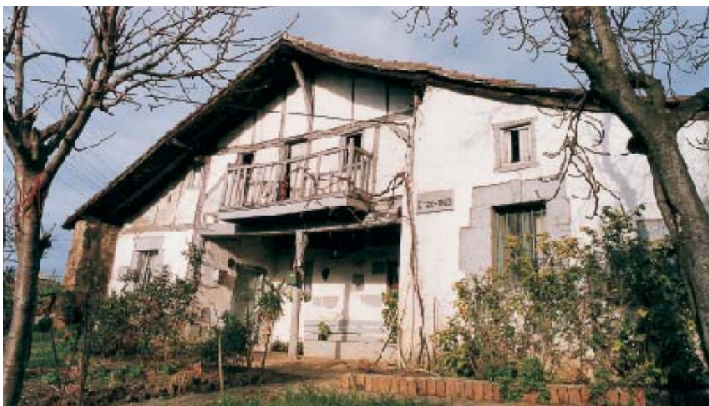
Etxeandi baserria, Aketxen.

Eraikina segurutik errenazimendu garaian eraiki zuten. Honako osagaiak ditu: isurialde biko estaldura, teilatuaren hegaldurari eusteko jabaloia, atarte hagaduna eta ohiko egurrezko egitura bigarren solairuan. Haren ondoan putzu bat dago. Oso zaharra izan arren, eta hainbat bider berriztatu bada ere, nahiko ondo jagonda dago.