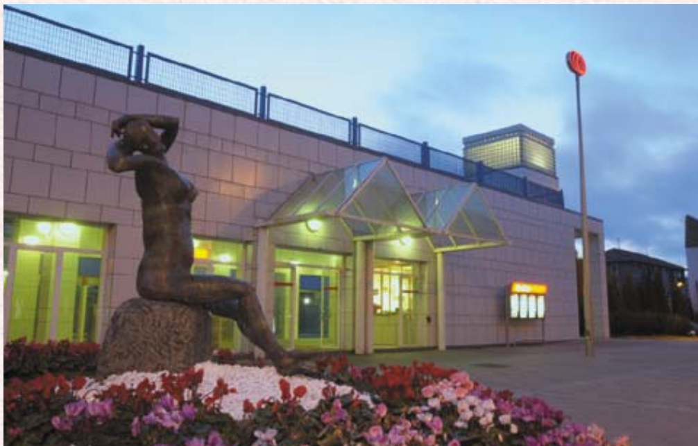
Lamiakoko metro geltokia.