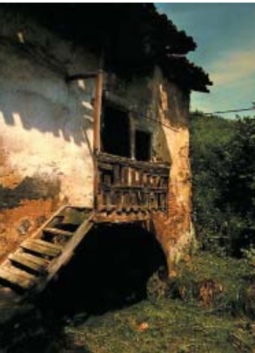
Elexaldeko errotaren kanpoko itxura, zaharberritu baino lehen.

Etxebizitza ere bazenez gero, baserrien ezaugarriak ere badauka: hurreko soloa, bidean dagoen egur-labea. Labea erabiltzen zen, artoa xigortzeko, irin xigortua lortu gura zutenean, edo arto goiztiarrari hezetasuna kentzeko.