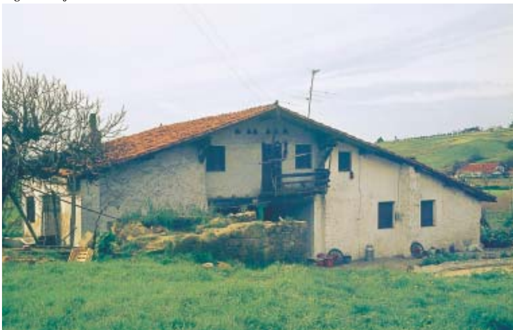
Larrakoetxe baserria, Perurin. 70eko hamarkada.

XVII. mendean erdialdean Catalina de Lejongoitia alargunaren zen, eta 1651n haren gainean 50 dukateko zentsua eratu zuen 177 . Haren ezaugarri berezigarrien artean honakoak aipatuko ditugu: oso altuera txikia dauka, bere luzera eta zabaleraren aldean; leihoak xeheak dira; teilatuaren hegaldurari jabaloiek eusten diote, eta usoetarako kofadurak ditu..