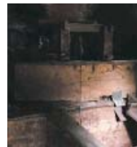
Hegazpea edo ehotarriak babesten dituen egurrezko estalkia: hautsa harrotu eta irina ateratzea saihesten du, eta gauzaki arrotzak sartzeko galarazten. Ezkerraldean, bereizita dagoela ikusten da, eta eskuineko aldean, egoera zuzenean, iraun duten ehotarri-pare bakarraren gainean.