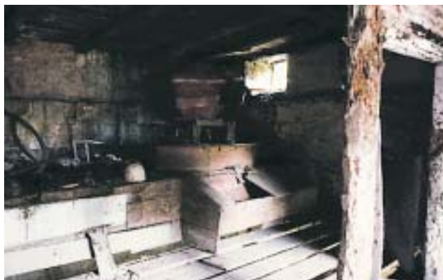
Ehotze-gela: kalapatxa edo tobera, astoa eta hari arrasto batzuk, ehotarriak babesten dituen hegazpea, eta askara begira dagoen belarria, aurreko aldean.