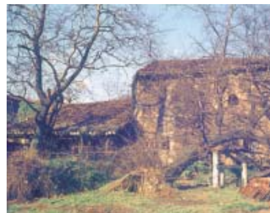
Ondizko dorretxearen edo Ondizdorrearen aztarnak. Horren gainean jaso zuten eraikinak ia erabat ostentzen ditu, baina egoera tamalgarria dago.

Neurri txikiko da, eta oinplanoa angeluzuzena. 7,75 metro gora da. gaur egun, hegoaldeetik baino ezin ikus daiteke (egun leiho den arku zorrotzeko ate mehar bat gailen da), ezen gainontzeko fatxadak erantsitako eraikinek eurenganatu dituzte. Ekialdean, leiho arku zorrotzeko leiho bat eta halako ate bat baino ez daude agerian, eta mendebaldean gezileiho bat, leiho zorrotz bat, gaztelubegi baten mentsulak arku zorrotzeko ate bat. Iparraldean badaude beste gezileiho bat, leiho estali bat eta teilatuak ebakitako beste bat, Erdi Aroan, leinuen arteko gudak amaituta, eginiko berriztatze-lanetan eraikitakoak guztiak. Lehen solairurako mailadia desagertu egin da.