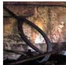
Metalezko orrikak eta oraindino gorde den ehotze-bankuko torlojua.

Eraikineko atalik ikusgarriena ehotzeko gela da. Bertan, errotarri biak lotzen ziren lekua gorde da (bata artorakoa, hareharrizkoa, eta bestea garirakoa, harri gogorragokoa –hori galduta dago). Eskuinaldeko alderdia ia osorik dago; bertan, artoa eta pentsua ehotzeko harria zegoen. Errotarriak babesten zituen egurrezko tiradera oraindino bertan dago (bai azpiharri edo aspiko errotarri finkoa, bai ardatzak edo transmisioak mugiarazten zuen goiko errotarria); orobat, hautsa ez ateratzeko edo kanpoko ezer ere ez sartzeko erabiltzen zen. Kalapatxa ere –ale-ontzia– bertan dago asto baten gainean, bai eta errotarrietara jausten ziren aleak doitzen zituen klaka ere. Garabi-beso bikoitzaren astoa ere gorde du. Goiko errotarria altxatu eta harri biak xehatu ahal izateko erabiltzen zen garabi xehe hori, alea ehotzeko harriak zituen arrakala edo marrazki-ertzak zorrozteko. Metalezko orrika eta haren torlojua ere heldu dira egundaino.