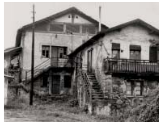
Udondoko baserriak. Gaurko egoera.

Laboreek egundoko garrantzia izan dute mendebaldeko elikaduran, eta aleak ehotzeko tresna baten premiak bultzaturik, errotak, oraintsu arte, ohikoa izan dira nekazaritza-gizarteen paisaia eta eguneroko bizitzan.