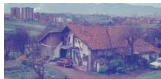
Pikaranda baserria, Perurin. 70eko hamarkada.

Hona, auzuneko beste baserri batzuk: Atzene 178 , Sutxus-Erdikoa eta Sutxus-Bekoa , Andikoetxe , Etxetxu , Pikaranda , Etxebarri , Madariarte eta Aurraketxe .