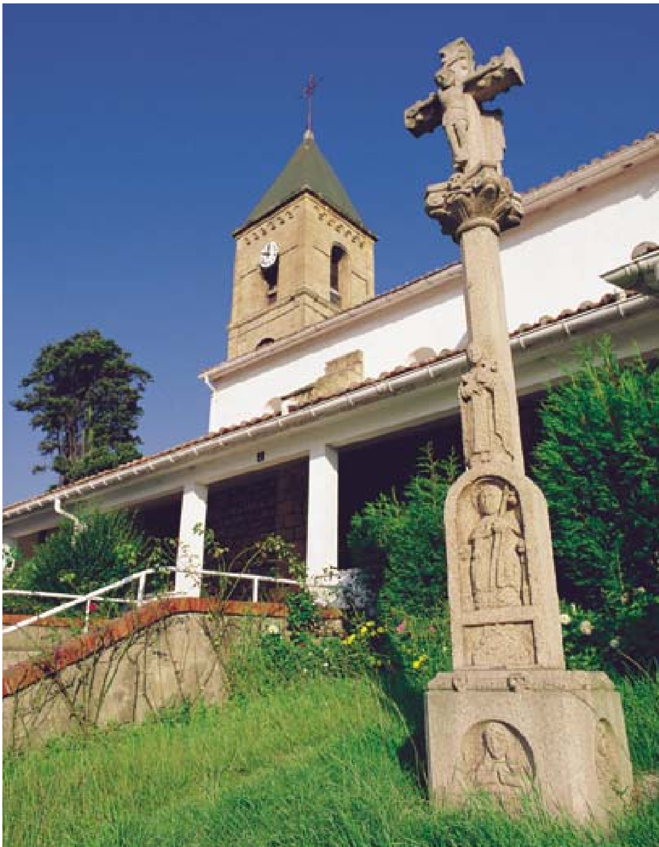
San Joan eliza, hainbat bider moldatua. Gaur egun aldatzen ari den berdegune baten erdian zegoen 70eko hamarkadan. Egilea: Asier Bastida.