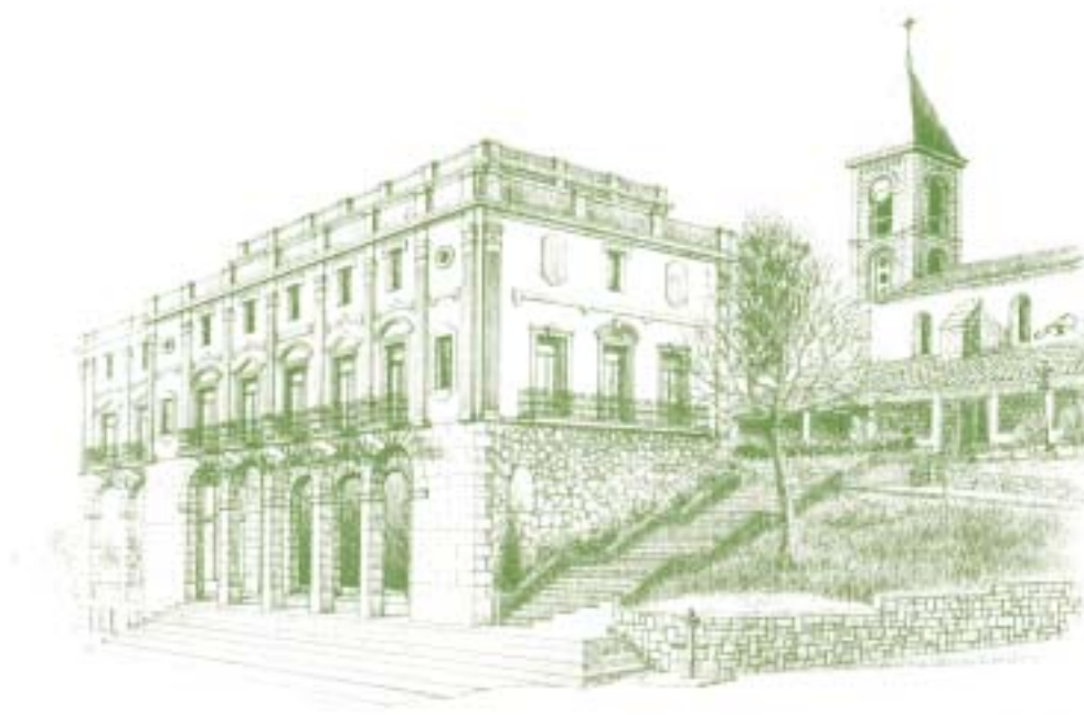
Leioako udaletxea XIX. mendearen amaieran eraiki zen, eta San Joan elizarekin batera, elizateko eraikin itzaltsuenetakoa da. Marrazkia: A.R.

1891an altxatu zuten eraikin neoklasiko hau, oinplano berriaz, mende hasieratik udaletxea zegoen lekuan. 1986an eta 1991n, zabaltze eta hobetze-lanak egin zituzten bertan. Portugalete eta Santurtziko udaletxeen eklektizismo bertsua dauka. Gorputz nagusiak hiru solairu dauzka, baina gero beste solairu xeheago eta atzeraeman bat erantsi zioten. Eskailera batetik puntu-erdiko arku batzuetara heltzen da, eta haien gainean lehenengo solairua dago; lehenengo solairuko kofaduren buruak txandaka daude apainduta. Bigarren solairuan, zerrenda ildodun batzuek banatzen dituzte kofadurak. Hirugarren solairuak, eremu handiagoaren premiak bultzaturik eraiki zena, ez dauka, arkitekturaren ikuspegitik, ezelako interesik.