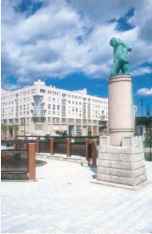
Leioako Boulevard.