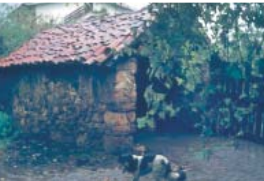
Etxebarria baserriko labea, Aketxen. 70eko hamarkada.