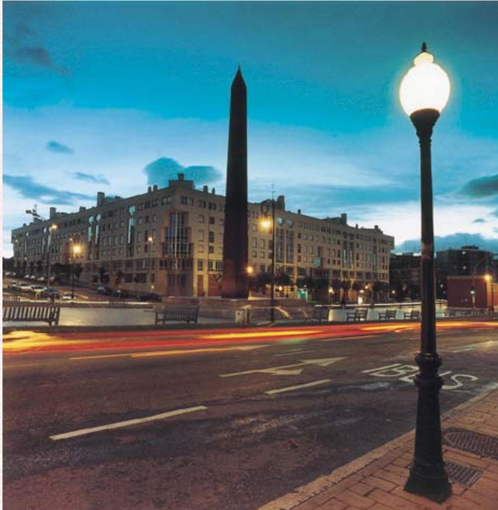
Leioako Obeliskoa. Egilea: Asier Bastida