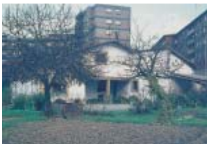
Bidekurtze baserria. 70eko hamarkada.

Bolatokia labearen ostean dago ezkutatuta, eta egun karrejua zegoen lekua baino ez da asmatzen bertan -landareek ia guztiz estalita dago baina.