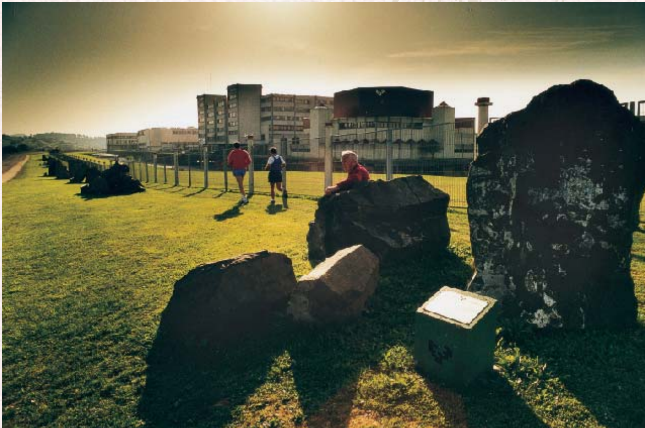
Euskal Herriko Unibertsitatea. Leioa. Egilea: Asier Bastida