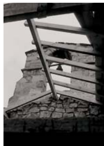
San Bartolome basilizako obrak.