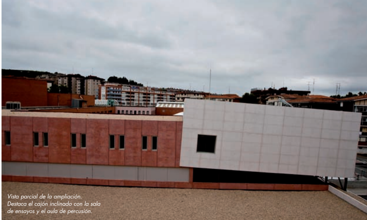
Vista parcial de la ampliación. Destaca el cajón inclinado con la sala de ensayos y el aula de percusión.

Auditorio, provocada por la cantidad de audiciones y la dinámica de ensayos de los numerosos grupos artísticos.