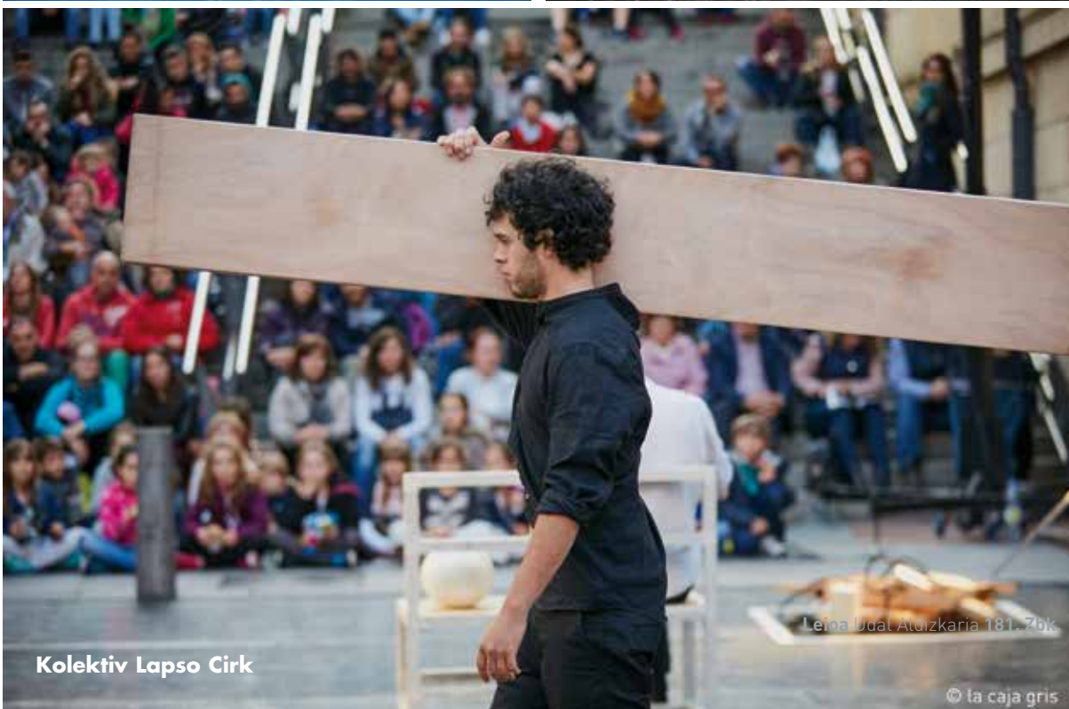
Kolektiv Lapso Cirk