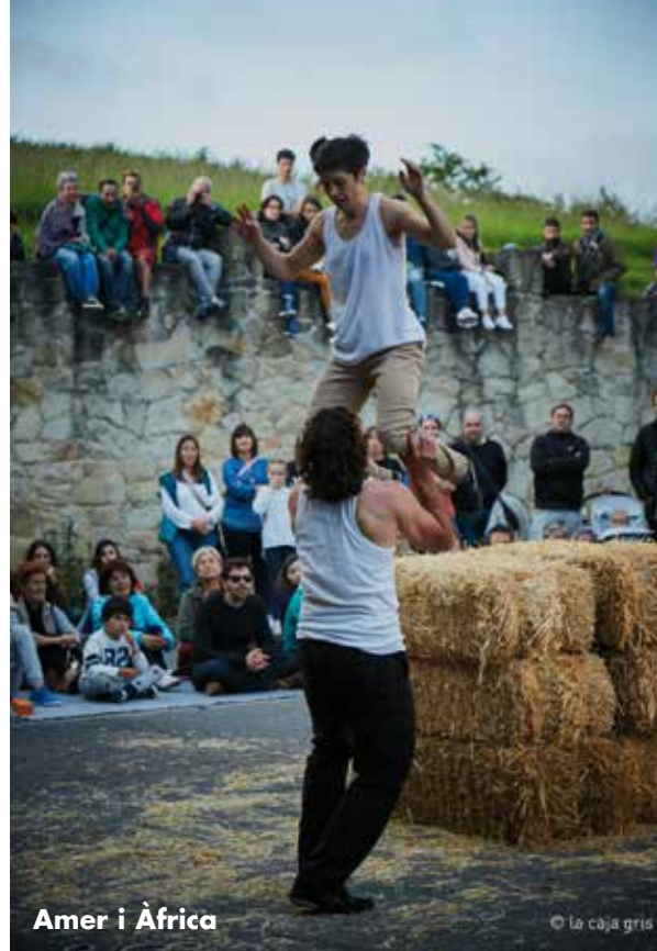
Amer i Àfrica