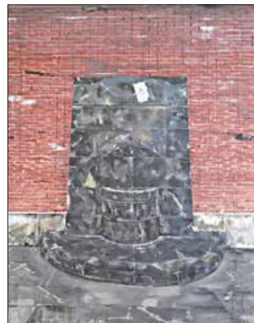
Tokiko lanik onena.