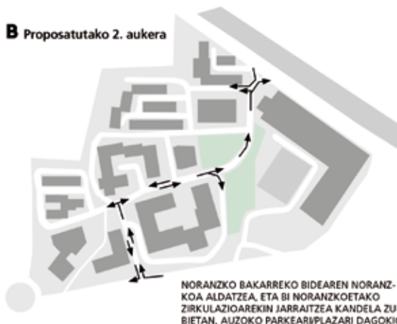
B Proposatutako 2. aukera

NORANZKO BAKARREKO BIDEAREN NORANZKOA ALDATZEA, ETA BI NORANZKOETAKO ZIRKULAZIOAREKIN JARRAITZEA KANDELA ZUBIETAN, AUZOKO PARKEAREN PLAZARI DAGOKION BIDE-ZATIAN IZAN EZIK.