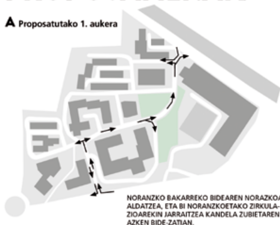
A Proposatutako 1. aukera

NORANZKO BAKARREKO BIDEAREN NORANZKOA ALDATZEA, ETA BI NORANZKOETAKO ZIRKULAZIOAREKIN JARRAITZEA KANDELA ZUBIETAREN AZKEN BIDE-ZATIAN.