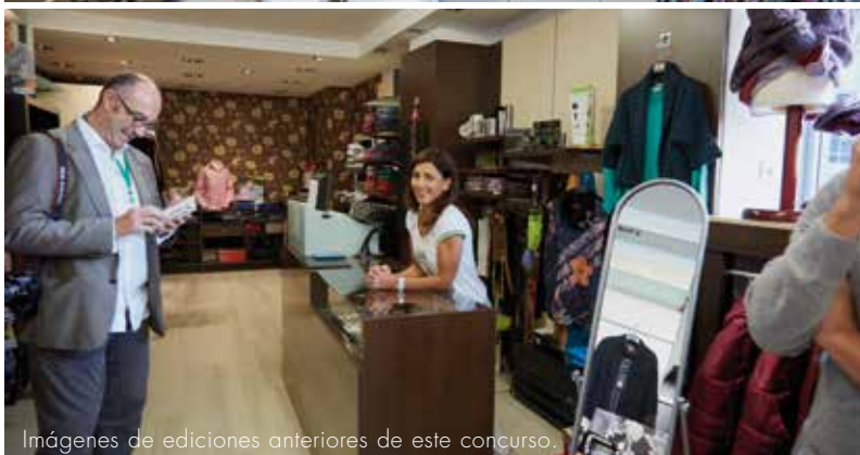
Imágenes de ediciones anteriores de este concurso.