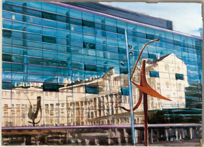
Leioako Kultur Etxea · Centro Cultural de Leioa Egilea · Autor: José Luis Aguirre

Udal Kontserbatorioa 94 463 86 83 Conservatorio Municipal