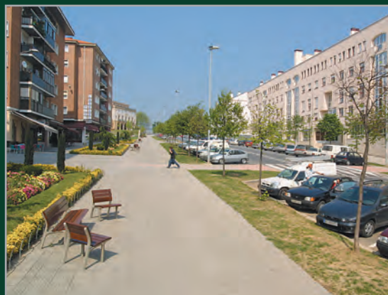
Avenida Elexalde Etorbidea

cuya denominación también se basa en los mismos criterios. Todos ellos se complementan con la denominación tradicional de la zona, Elexalde, que desde hace siglos da nombre al barrio que acogía el centro histórico del municipio y con el Centro Cívico que acoge en su seno las sendas plazas de José Ramón Aketxe y Errekalde, otro topónimo que hace referencia al arroyo y caserío cercanos. ■