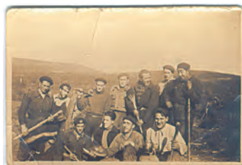
Batallón de Gudarís de Leioa y Erandio.

E l Ayuntamiento de Leioa actuará conjuntamente con los cuarenta municipios vascos de los que se tiene constancia fehaciente que sufrieron la incautación de documentación por las tropas franquistas. Todos los municipios afectados han delegado en la Asociación de Municipios Vascos, EUDEL, mediante el correspondiente Acuerdo Plenario, para que realice las gestiones oportunas ante el Ministerio de Educación, Cultura y Deportes del Gobierno del Estado Español, a fin de que se restituya a cada Ayuntamiento vasco cualquier tipo de documentación incautada en el período 1936-1939, o en los años inmediatamente posteriores, y