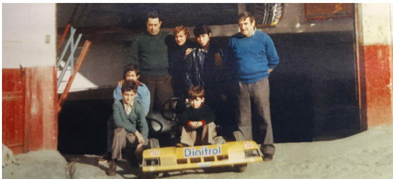
Dos generaciones de la familia Fuente, posando en el taller de Leioa.

A lo largo de cinco décadas, la empresa irá pasando por diferentes etapas, adaptándose a los diferentes escenarios: en los años 80, formando parte de la red de Citroen, ocupándose de la venta y reparación de automóviles nuevos; en los 90, con la entrada en el negocio de la segunda generación, se potencia el vehículo de ocasión; en 2001, se adhieren a la red de Peugeot, con el concesionario Amaia Car; en 2016, se especializa exclusivamente en coches de ocasión y se expande en