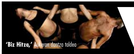
‘Biz Hitza,’ Aukeran dantza taldea

Aukeran dantza taldea ofrecerá ‘Biz Hitza’ un espectáculo que tiene como punto de partida la historia universal de todas las lenguas del mundo, pero pretende contar a partir de la danza la historia particular del euskera batua. (27NOV).