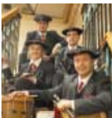
Bilbaoko Udal Txistu banda

La Banda Municipal de Txistularis de Bilbao es una de las poquísimas agrupaciones profesionales de tamborileros del mundo, un testimonio vivo de lo que en la Edad Media fueron las agrupaciones municipales de ministriles y juglares. Antaño llamados juglares, últimamente más conocidos como txistularis, la figura del flautista acompañado por su tambor es parte de la entidad cultural de nuestro pueblo, elemento conservador y difusor de nuestros repertorios más antiguos y, casi siempre, símbolo de Bilbao. ■