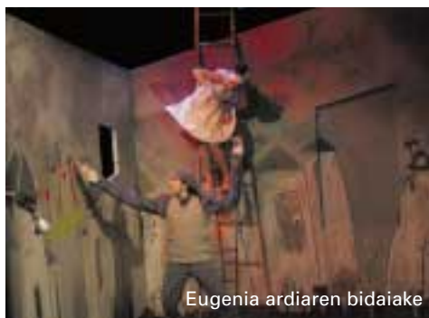
Eugenia ardiaren bidaiake