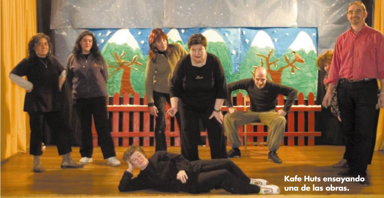
Kafe Huts ensayando una de las obras.

forman en un curso de expresión creativa con un monitor y disponen de material para la puesta en escena. El grupo está formado por 20 mujeres (y dos hombres como socios colaboradores) "con deseo de relacionarse, de salir de su aislamiento familiar e integrarse en la