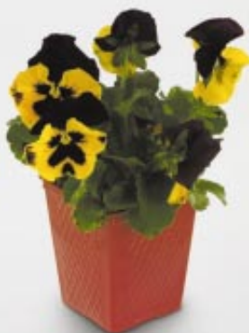
viola x wittrockiana