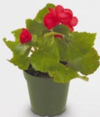
begonia x tuberhybrida