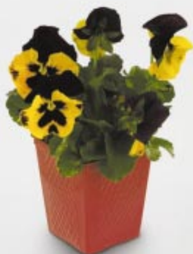
viola x wittrockiana