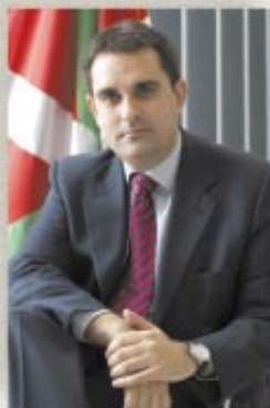
Eneko Arruebarrena Elizondo LEIOAKO ALKATEA