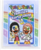
Pirritx eta Porrotx: Familien Karta-Jokoa